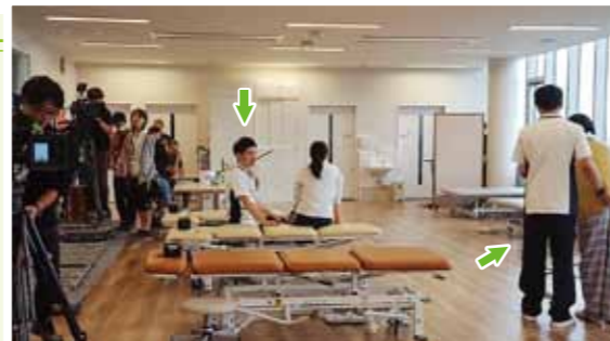
「パーフェクトワールド」最終回に、当センターの理学療法士・言語聴覚士がエキストラとして出演。

TBS金曜ドラマ山下智久主演「インハンド」の1話・9話や原田知世、田中圭主演、日本テレビ日曜ドラマ「あなたの番です」、関西テレビ火曜ドラマ松坂桃李主演「パーフェクトワールド」などの撮影に、当センターの職員もエキストラとして出演協力をしました。