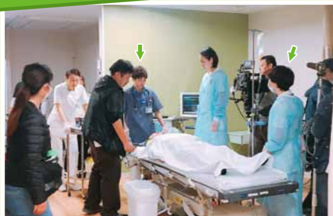
「インハンド」第1話にて当センター看護師職員が、実務経験を活かした役柄でエキストラとして出演。