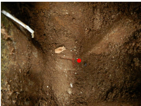
P6 (コンクリート杭面)