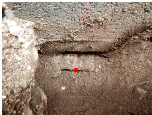
P7 (コンクリート杭面)