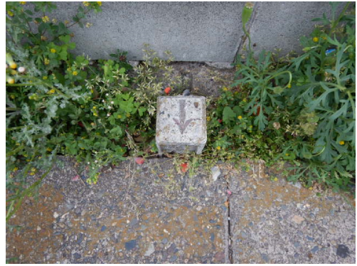
37 (市コンクリート杭)