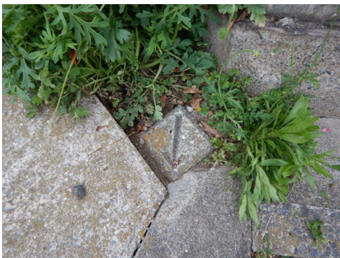
36 (市コンクリート杭)