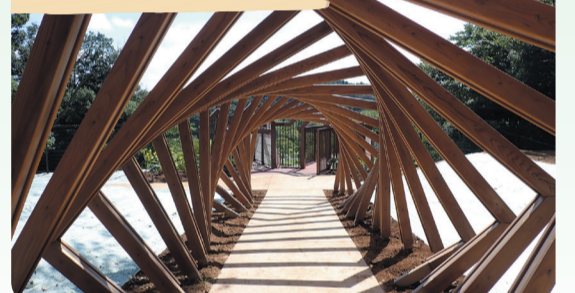
バーベキュー場から「あそびのすみか」へ導き、期待感を高めるタイムトンネルをイメージ