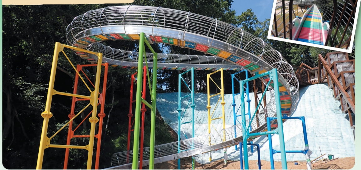
地上10メートルの高さから木々の横を滑り降りる全長50メートルのローラー滑り台