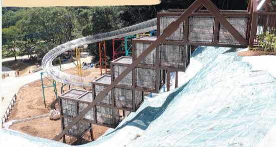
ネットボックスの中の不安定な足場で身体能力とバランス感覚を鍛えながら遊ぶことができるネットクライム