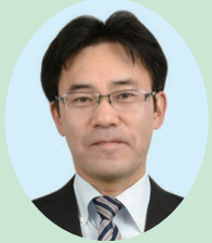
第70代副議長 いわほりけんし 岩堀研嗣

松戸市議会の情報はホームページからもご覧いただけます。(https://www.city.matsudo.chiba.jp/gikai/index.html) 右のQRコードもご利用ください。