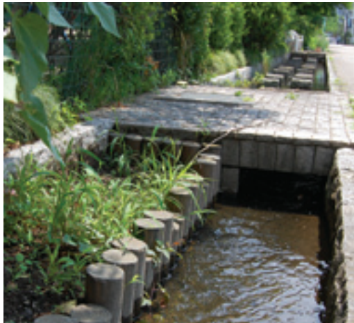
水質浄化意識の普及を目的とした南部小学校脇の小山親水水路