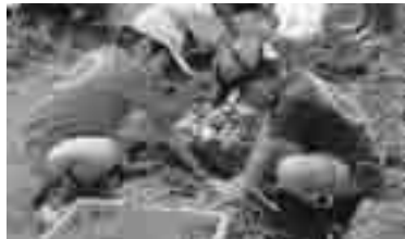
じゃがいもが、いっぱい振れました

クーパー券を配布することで、検診を受けやすくするとともに、がんについての正しい知識を解説した「女性のための健診手帳」を交付する。クーパー券配布までの間に受診された方へは、自己負担金の償還払いを予定している。