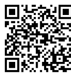
Ủy ban giáo dục

Chi tiết vui lòng truy cập website dưới đây