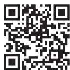
PC / スマートフォン

フィーチャーフォン（ガラケー）※ https://m.sugumail.com/m/matsudo/home ※ SHA-2 非対応機種では Web 画面に係る操作は、ご利用 いただけません。