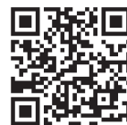
フィーチャーフォン （ガラケー）