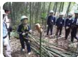
ボランティア体験