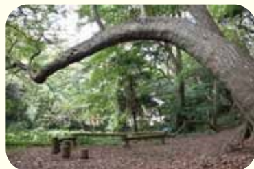
屋敷林には不思議な形の樹木もある