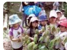
赤ちゃんの葉っぱ やわらかいね