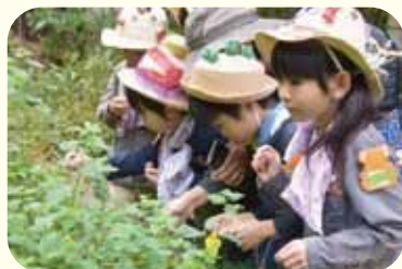
森を訪れた保育園児たち

住宅地と道路に囲まれた約 2ha の里山空間。内 80% が「特別緑地保全地区」に指定されている。屋敷林・梅林・関家の庭などからなり、散策・学習・体験・癒しの場として活用されている。屋敷林は常時開放。維持管理作業を中心に、観察会・花まつり・そうめん流しなど開催。また江戸時代から残る門や蔵の維持と、昔の生活道具や古文書の調査活動も行い、エコミュージアムとしての整備を進めている。