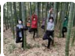
あおぞらヨガ教室!?