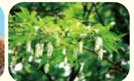
クマシデの若い果穂