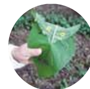
葉っぱのフクロウ