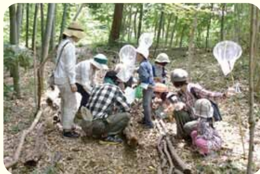
夏休みに実施した「虫とあそぼう！」

森のベンチに座っていると、キツツキが木をつつく音や小鳥の声が聞こえ、木々の緑に癒されます。どうぞお散歩においでください。