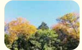
モミとケヤキの紅葉