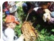
木を食べる虫かな？