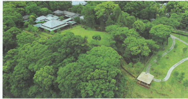
- 戸定邸 (国指定重要文化財)・旧徳川昭武庭園 (国指定名勝)

科学と芸術の丘は、創造性豊かな「クリエイティブ・シティまつど」を目指す松戸市と、クリエイティブな活動を実践するメンバーや世代を超えた多くの市民や有志の皆さんと共に、徳川昭武の核心の歴史が残る戸定が丘をメイン会場に開催する国際フェスティバルです。6年目を迎える今回は「Seeds of Hope ～ここで、あそぶ時間～」をテーマに、真実への問いに対して多面的な希望を見出す世界中のアーティスト・研究者による特別展覧会、トーク、ワークショップ、マルシェ、そして街のカタリストを通じて未来の社会について考えます。